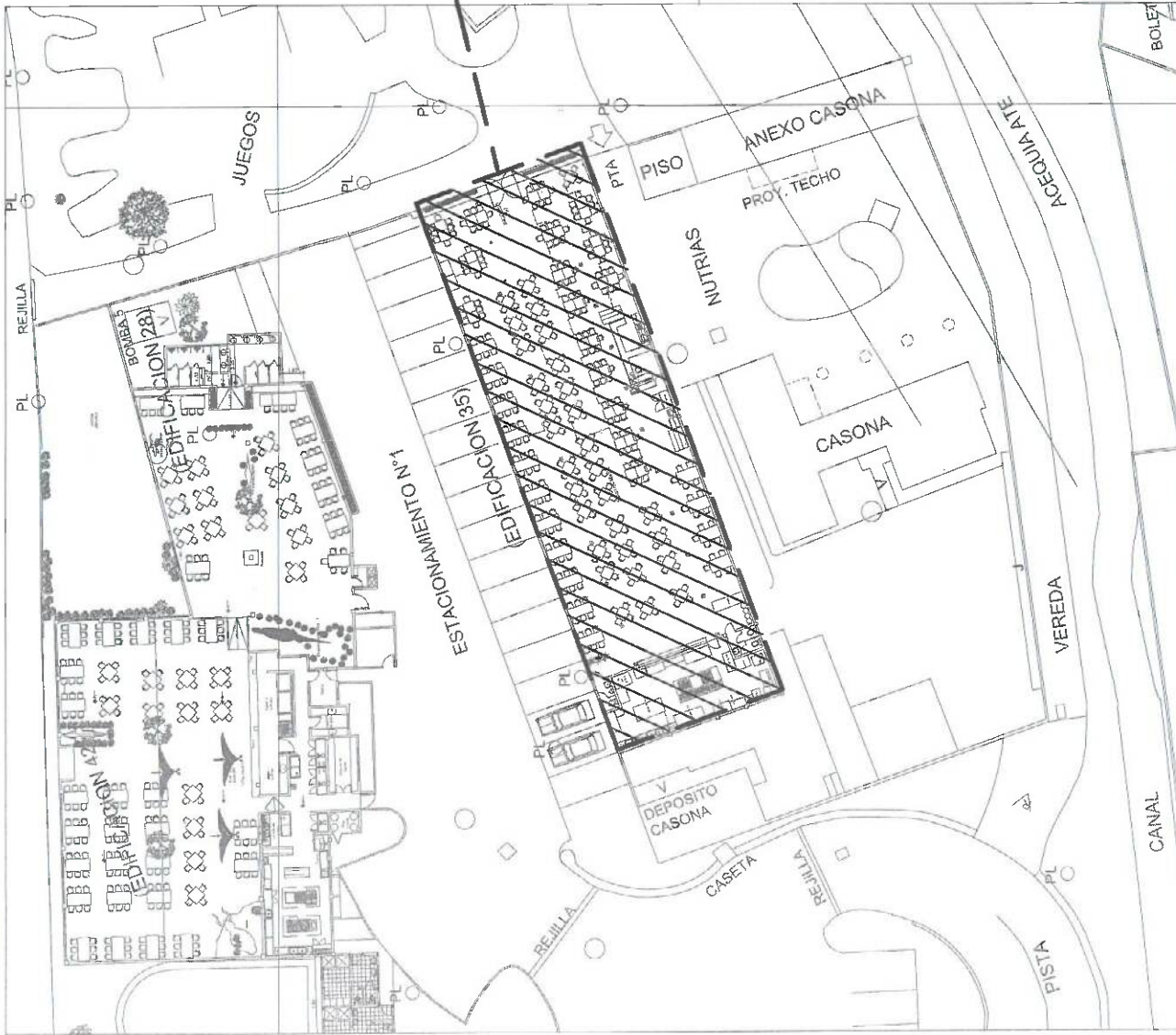
PLANO DE UBICACION